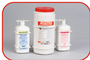
Koszyk 3 częściowy Nr kat. 500121