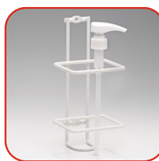
Dysp. do butelki 1l Nr kat. 500123 Koszyk na ścianę Nr kat. 500122