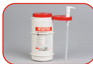
Dyspenser EKO 3l Nr kat. 500205