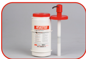
Dyspenser PEVA 3l Nr kat. 500103 Koszyk na ścianę Nr kat. 500104