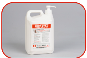
Dyspenser EKO 5l Nr kat. 500198