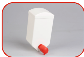
Dysp. do napełniania 2,5l Nr kat. 500105