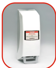
Dyspenser do miękkiej butelki Nr kat. 500178