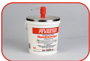
Dyspenser PEVA 10l Nr kat. 500109