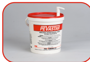
Dyspenser EKO 10l Nr kat. 500209